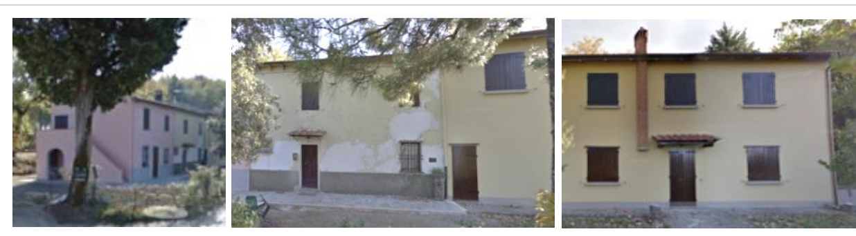
Figura 2 – Immobile oggetto dell'istanza

L'art. 39 comma 16 delle norme del RUC, dispone che per gli edifici di interesse culturale è facoltà degli interessati segnalare all'Amministrazione Comunale eventuali errori di attribuzione della suddetta classe di interesse e l'Amministrazione provvede alla valutazione tecnica della segnalazione e, qualora riscontri incoerenza tra l'attribuzione della classe e i criteri medesimi, apporta la variazione alla classificazione mediante deliberazione del Consiglio Comunale.