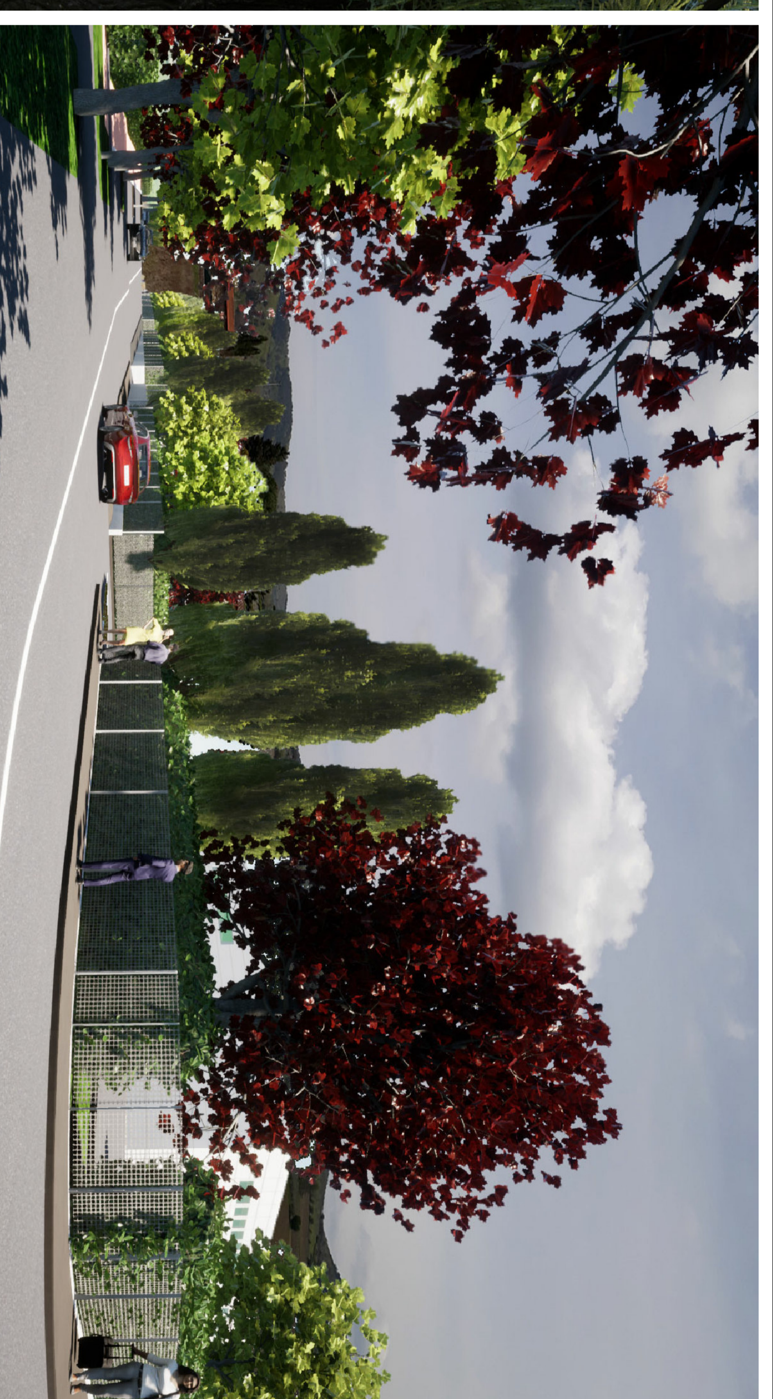
RENDERING - Vista n. 4