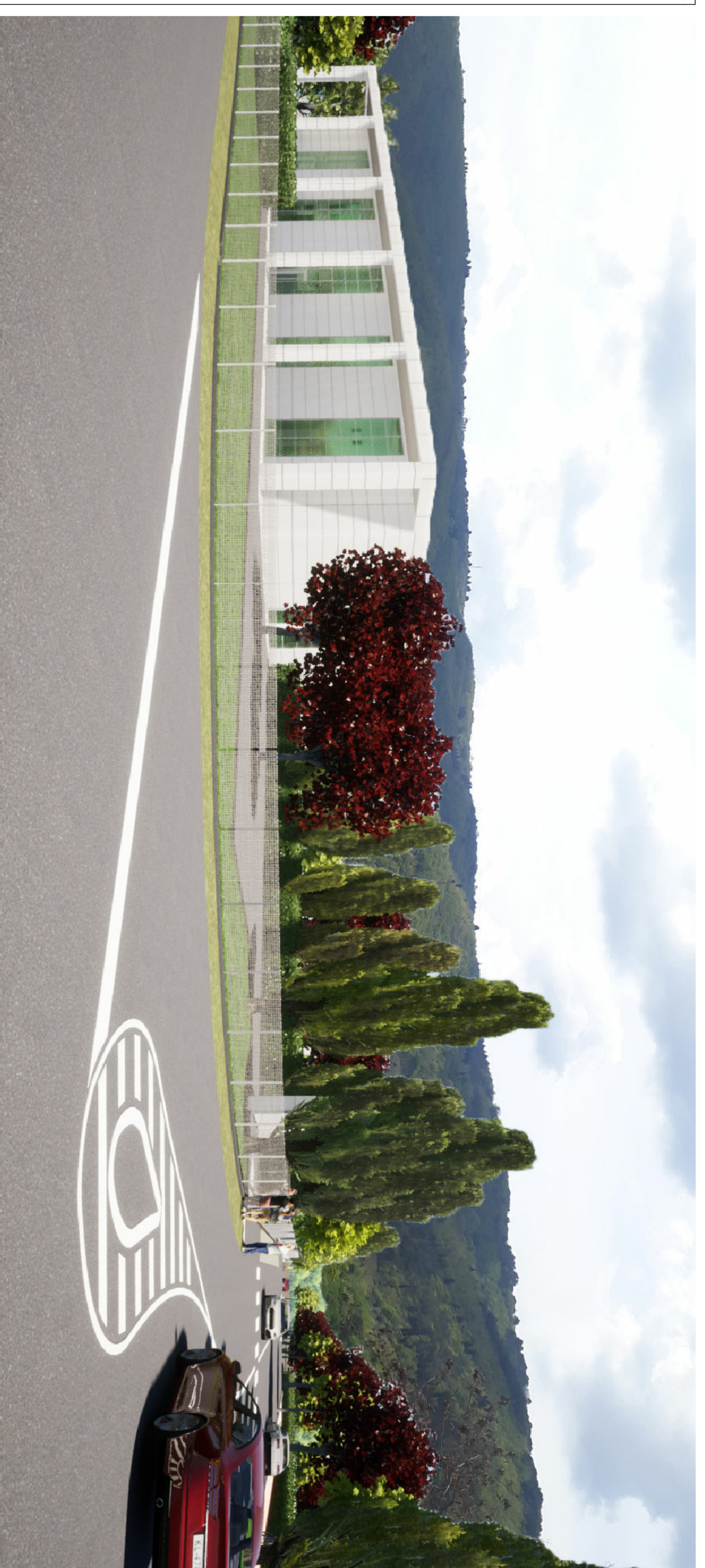
RENDERING - Vista n. 2