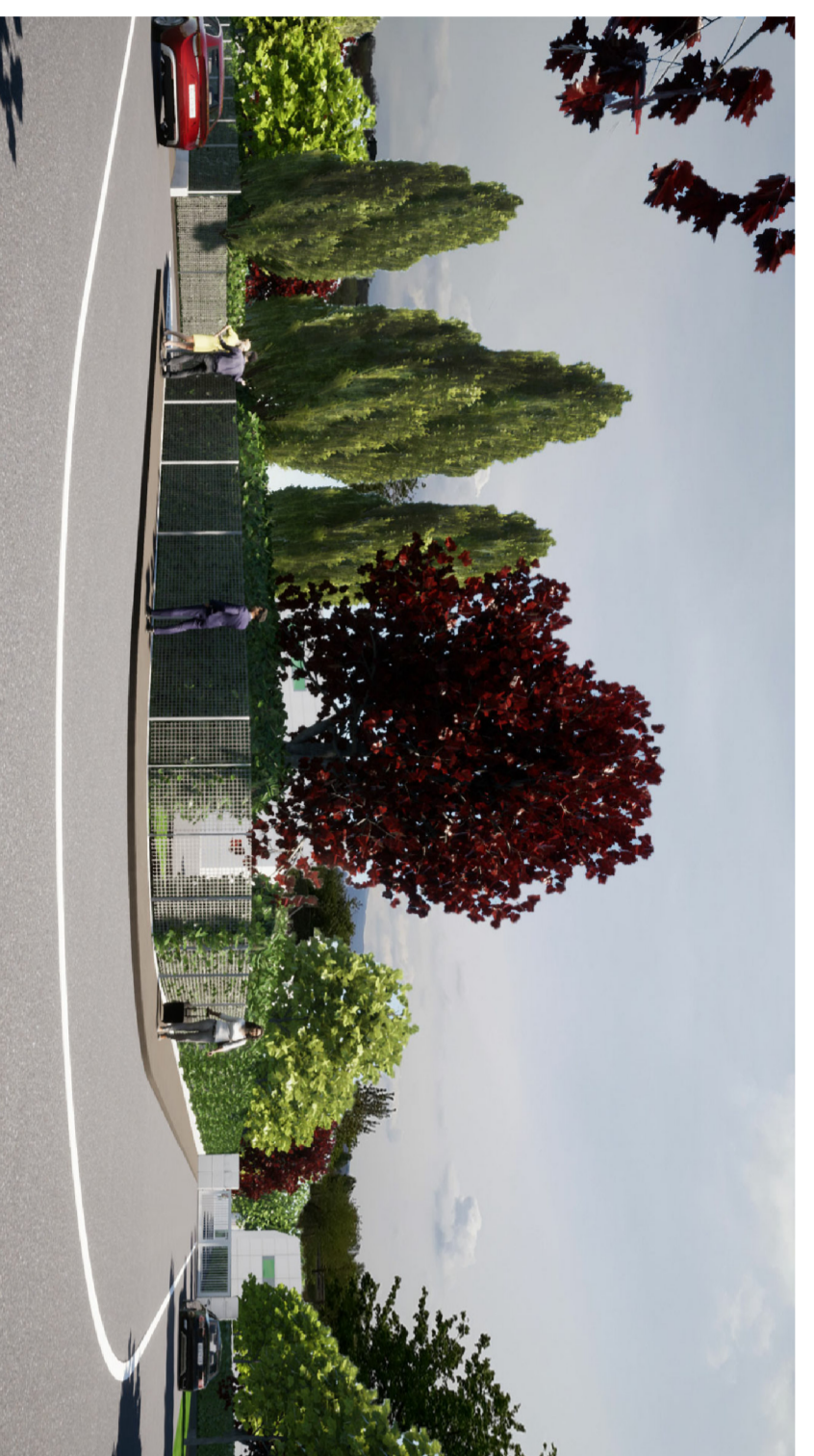
RENDERING - Vista n. 5