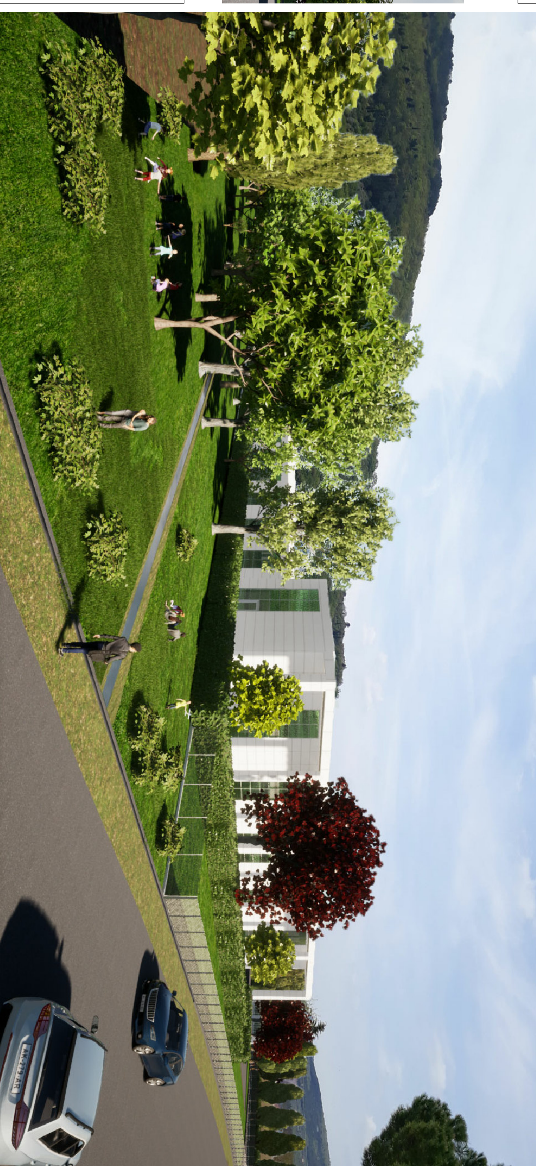
RENDERING - Vista n. 1