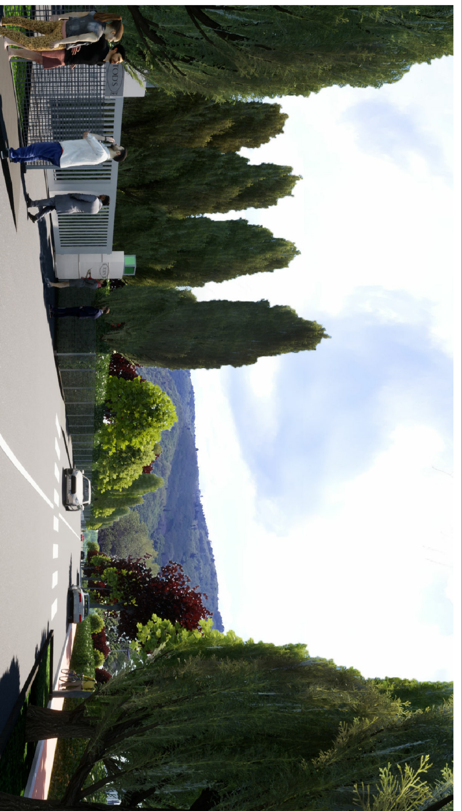
RENDERING - Vista n. 3