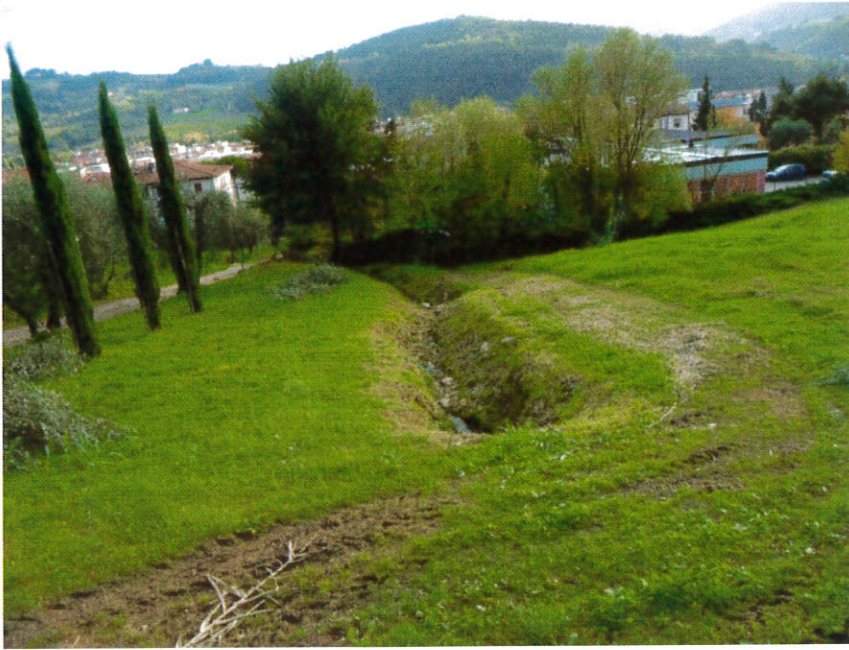
Tratto di fosso a valle compreso tra l'asilo nido e il podere Cosso

Il progetto prevede il mantenimento del tratto a monte a cielo aperto con risagomatura delle sponde e della sezione trasversale del fossetto e sistemazione della vegetazione. Il tratto a valle, vicino ai fabbricati ed all'asilo sarà intubato per motivi igienico sanitari.