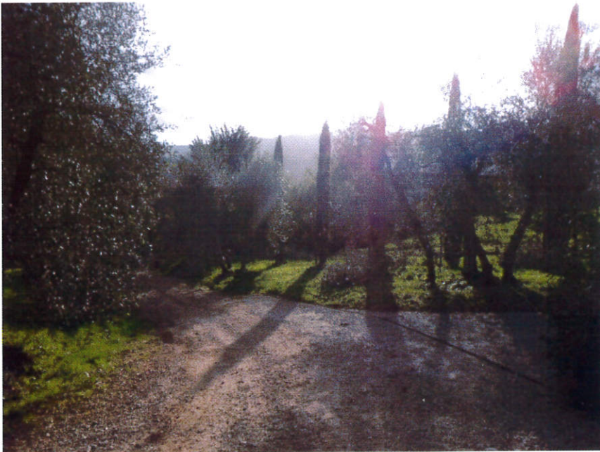
Fila di cipressi visti dalla strada di accesso alla fattoria

La formazione lineare arborea consiste in una fila di cipressi piantati dalla fattoria Balbi nel 2009, quale cortina per interdire l'accesso al terreno olivetato e al fosso (a cielo aperto) dalla strada sterrata che porta alla fattoria essendo detta strada molto frequentata a piedi dai Pontassievesi per raggiungere la fattoria o per passeggiate.