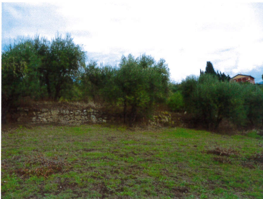
Particolare muro verso est

Trattasi di un muro in pietra di remota realizzazione, costruito allo scopo di ridurre la pendenza del versante creando un terrazzamento ampio da poter essere coltivato a coltura mista di seminativo ed olivi; oggi il seminativo non viene praticato, il terreno è mantenuto ad inerbimento e olivetato.