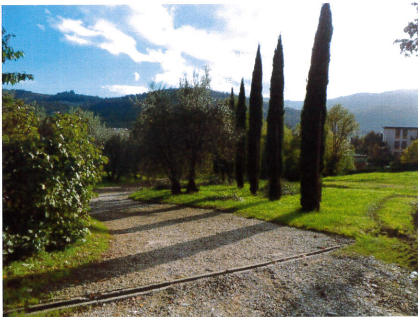
Fila di cipressi visti dal podere Cosso