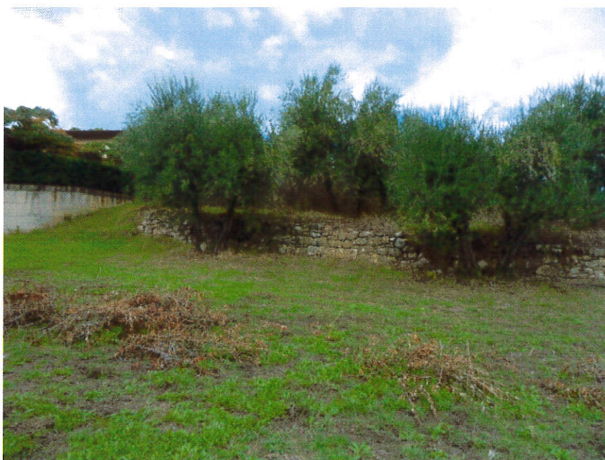
Particolare muro verso ovest