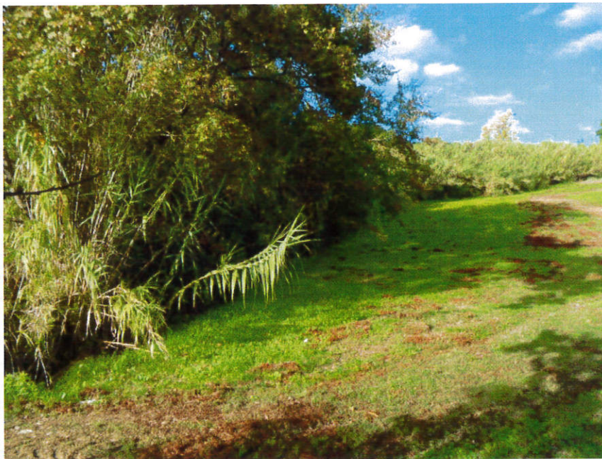
Tratto di fosso a monte del podere Il Cosso